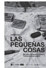
EXPOSICIÓN LAS PEQUEÑAS COSAS