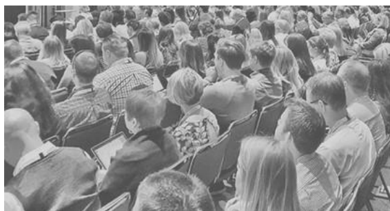
Públic assistent a l'acte

Nova Planta i la necessitat d'unificar l'ortografia, fets que el van encoratjar a publicar diversos articles als diaris i fins i tot un assaig a 1891 que va ser germinal per a la posterior publicació de les Normes Ortogràfiques de 1913, la Gramàtica Catalana de 1918 i finalment el Diccionari Català de 1932, tots ells vigents fins a pràcticament a dia d'avui, ja que des de fa pocs anys és l'Institut d'Estudis Catalans qui s'encarrega de l'actualització de les normes.